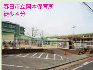
春日市立岡本保育所 徒歩4分