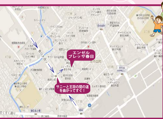
エンゼル ブレッサ春日