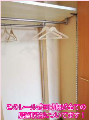
このレール式可動棚が全ての 居室収納についてます！