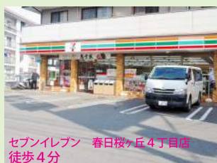
セブンイレブン 春日桜ヶ丘4丁目店 徒歩4分