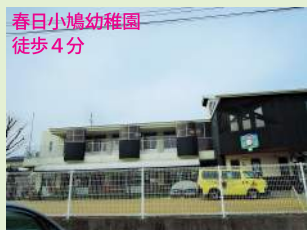
春日小鳩幼稚園 徒歩4分