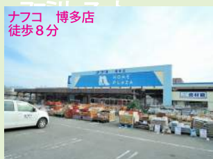
ナフコ 博多店 徒歩8分