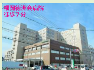
福岡徳洲会病院 徒歩7分