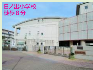
日ノ出小学校 徒歩8分