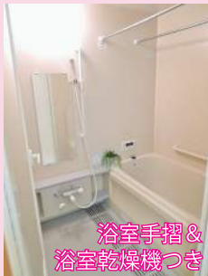
浴室手摺 & 浴室乾燥機つき