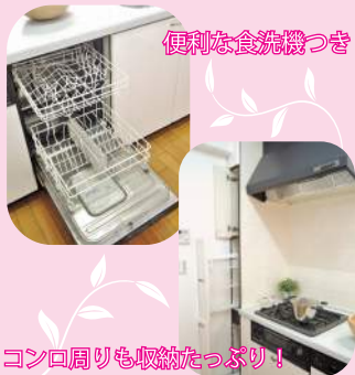
便利な食洗機つき