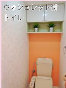
ウォシュレット付 トイレ