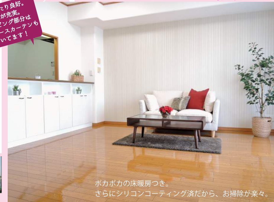
ポカポカの床暖房つき。 さらにシリコンコーティング済だから、お掃除が楽々。