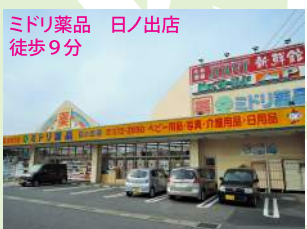
ミドリ薬品 日ノ出店 徒歩9分