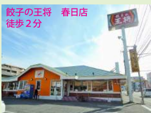
餃子の王将 春日店 徒歩2分