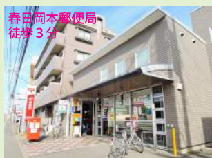
春日岡本郵便局 徒歩3分