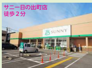
サニーの出町店 徒歩2分