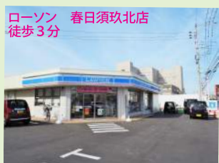
ローソン 春日須玖北店 徒歩3分