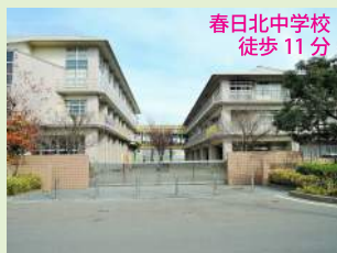
春日北中学校 徒歩11分

日ノ出小学校まで徒歩8分、春日北中学校まで徒歩11分。 保育園や幼稚園も徒歩圏内、小さいお子様がいらっしゃるご家族が安心できるエリアです。