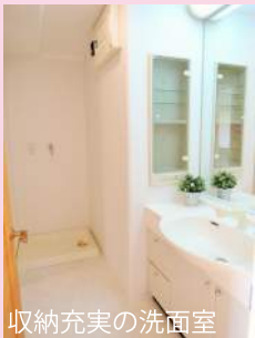
収納充実の洗面室