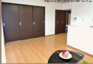
建具新調しました