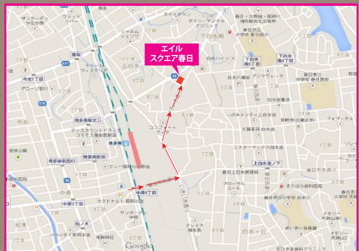
カーナビご利用の方 春日市上白水8-13 エイルスクエア春日