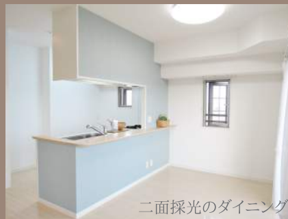
二面採光のダイニング