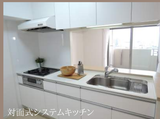
対面式システムキッチン