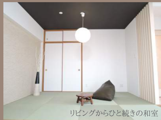
リビングからひと続きの和室