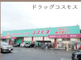
ドラッグコスモス