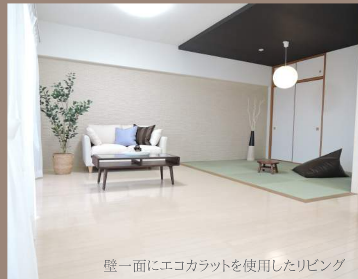
壁一面にエコカラットを使用したリビング