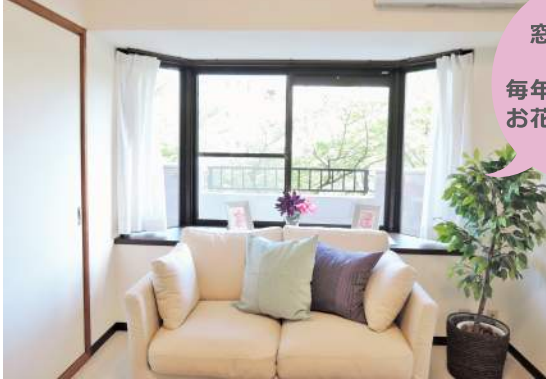
リビング出窓からの眺望