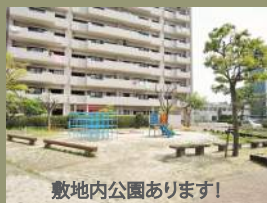
敷地内公園あります!

買い物・教育・利便性に優れた 暮らしやすい立地。 共用部も充実で、 日々の生活にゆとりを 与えてくれます。