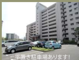
平置き駐車場あります!