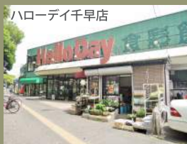
ハローデイ千早店