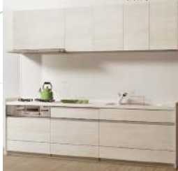
LIXIL システムキッチン新調