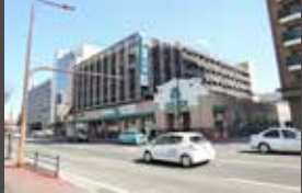
サニー吉塚駅前店