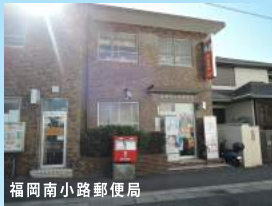
福岡南小路郵便局