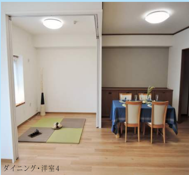
ダイニング・洋室4

全室 LED 照明付き。電気代は白熱球の約 1/8。 地球にお財布に優しい暮らし始めませんか。