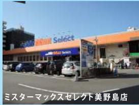
ミスターマックスセレクト美野島店