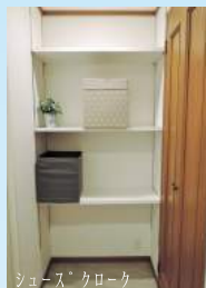
シューズクロック