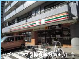
セブンイレブン博多美野島4丁目店