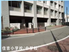
住吉小学校/中学校