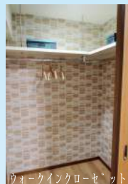
ウォークインクローゼット