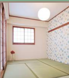
和室は明るく個性的な印象。 押入れが一間あります!