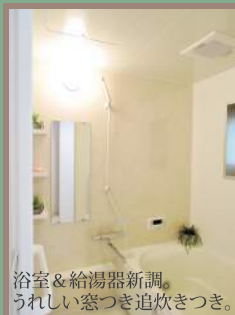
浴室&給湯器新調。 うれしい窓つき追炊きつき。