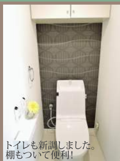
トイレも新調しました。 棚がついて便利!