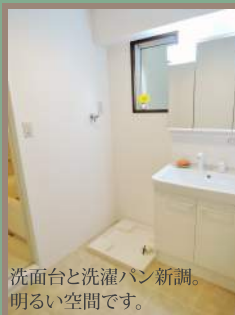
洗面台と洗濯パン新調。 明るい空間です。