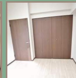
居室は全て2窓。 LED照明もついています!