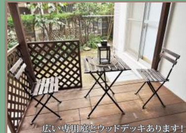
広い専用庭とウッドデッキあります!