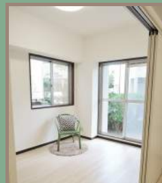
専用庭に面した洋室。 リビングとつながった使い方も。