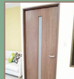
室内ドアも全て新調しました!