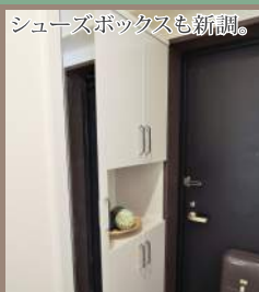
シューズボックスも新調。