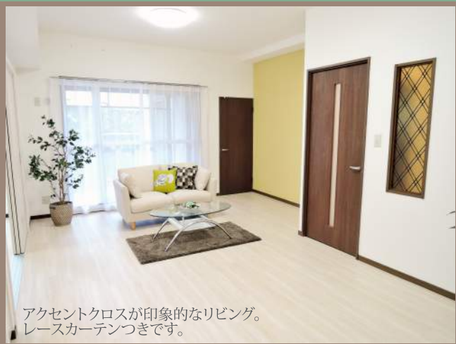
アクセントクロスが印象的なリビング。 レースカーテンつきです。