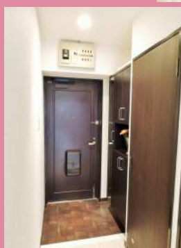
玄関には シューズボックス新調！ 横に大容量の収納も あります！