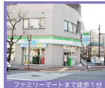
ファミリーマートまで徒歩1分