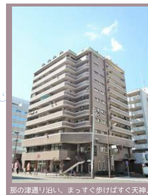
那の津通り沿い、まっすぐ歩けばすぐ天神♪