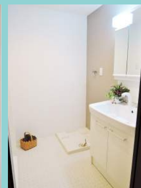
洗面台と洗濯パンも新調！ 広めの洗面室です。