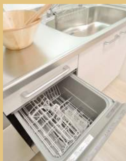
うれしい食洗機つき！