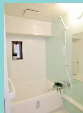
浴室はうれしい窓つき！ 1216サイズで広めのサイズ。 新品のお風呂はうれしい！