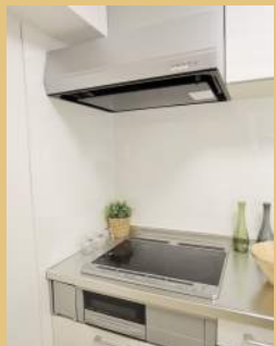
3口IHコンロ& 最新式レンジフード！