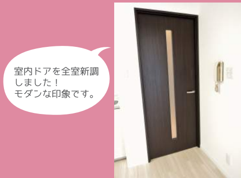
室内ドアを全室新調 しました！ モダンな印象です。