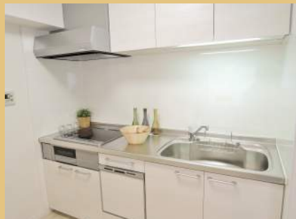
収納もたっぷりあります！