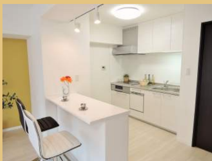
このカウンターとカウンターチェアもついています！