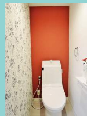
トイレはアクセントクロスで 華やかな印象に…