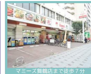
マミーズ舞鶴店まで徒歩7分