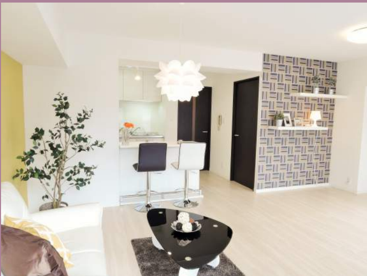
LDKはひろびろ16帖！全室にLED照明ついています！