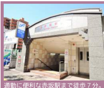
通勤に便利な赤坂駅まで徒歩7分。