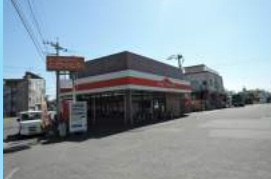
吉田フードセンター