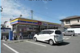
ミニストップ福岡大岳店