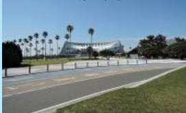
海ノ中道海浜公園 マリンワールド海の中道