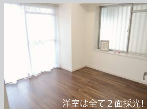
洋室は全て2面採光!