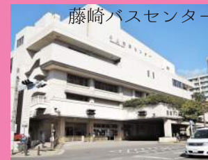
藤崎バスセンター