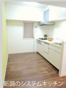
新調のシステムキッチン