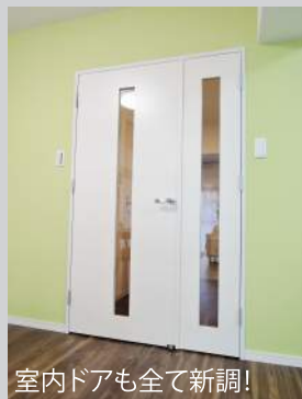
室内ドアも全て新調!