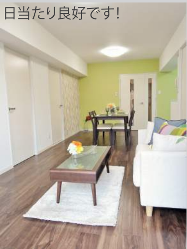
日当たり良好です!