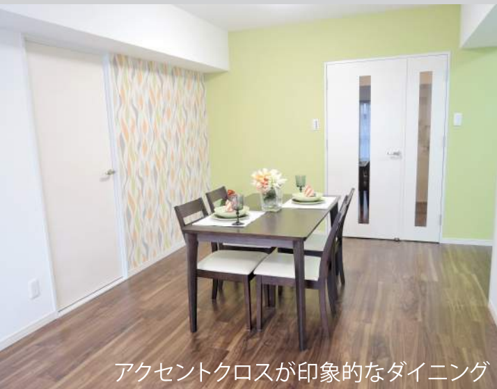
アクセントクロスが印象的なダイニング