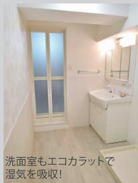
洗面室もエコカラットで湿気を吸収!