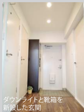
ダウンライトと靴箱を新設した玄関