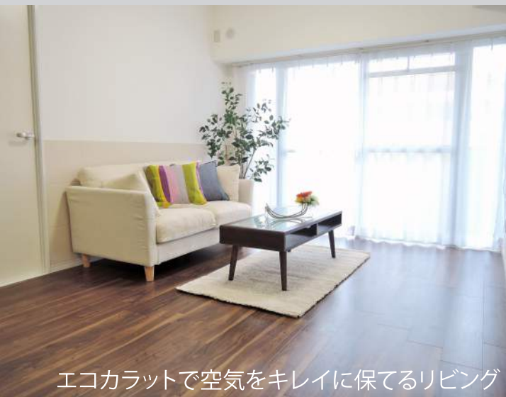
エコカラットで空気をキレイに保てるリビング