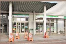
ファミリーマート吉塚駅前店