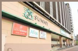
サンリー 吉塚駅前店