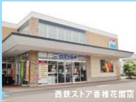
西鉄ストア香椎花園店