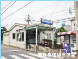
西鉄貝塚線唐原駅

買い物・教育・病院等全てそろって充実環境。 余裕あるあなたのライフスタイルを叶えます。