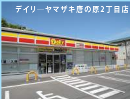
デイリーヤマザキ唐の原2丁目店