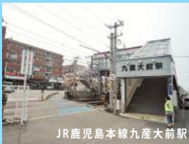
JR鹿児島本線九産大前駅