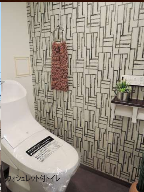
ウォシュレット付トイレ